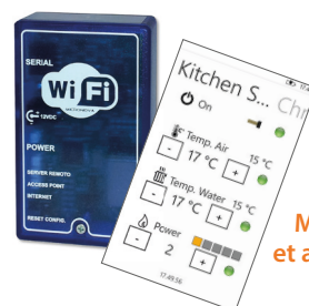
Module Wifi et application DARWIN

Pilotez ou programmez votre insert selon votre rythme de chauffage. Grâce au module Wifi et son application DARWIN (en option) pour gérer à distance de votre appareil via un équipement mobile smartphone ou tablette, ou à l'aide du thermostat d'ambiance OSCAR (en option) pour programmer son fonctionnement.